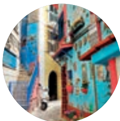
Vietri sul Mare (p. 161), Costa Amalfitana.