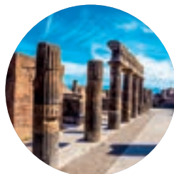
Pompeya (p. 101).