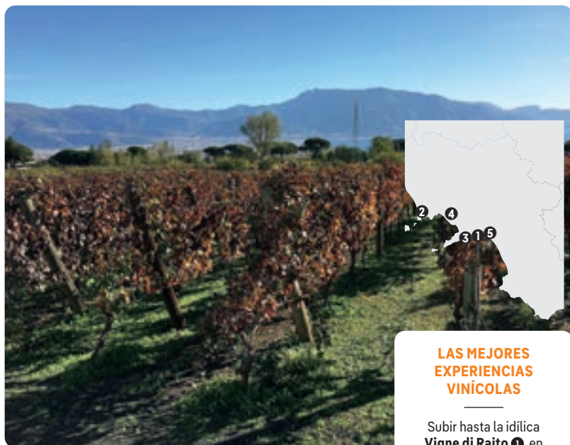
Cantina del Vesuvio (p. 98), monte Vesubio.