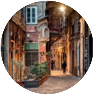
Arriba: 'caruggi' de Génova (p. 44). Abajo: Portofino (p. 53).