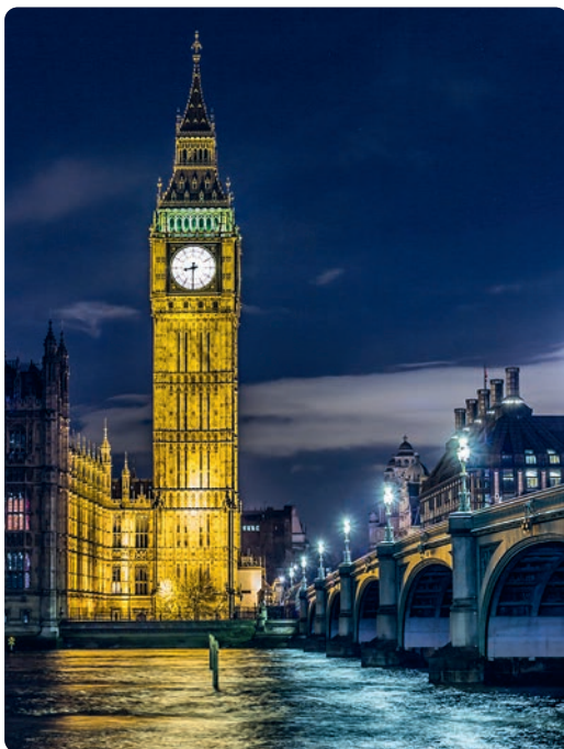
Elizabeth Tower (p. 71).