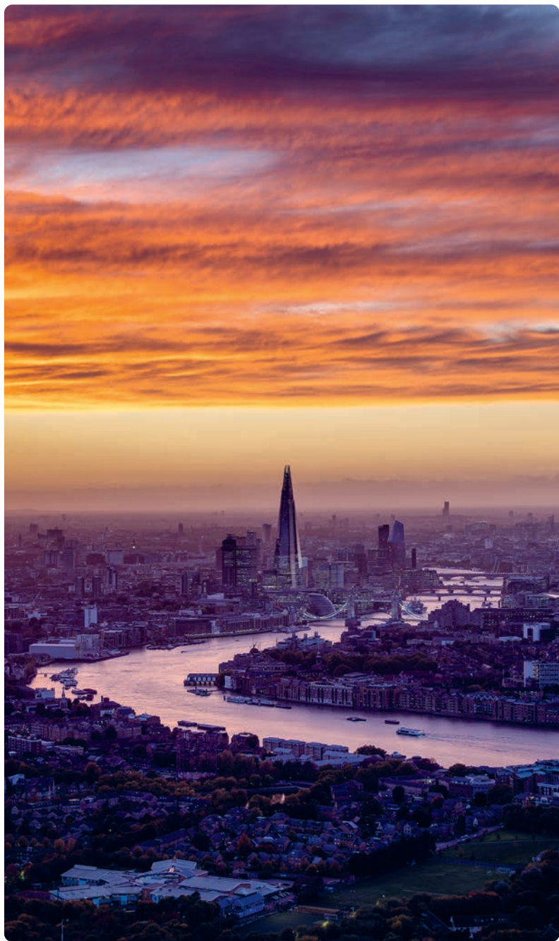
Vista de Londres.