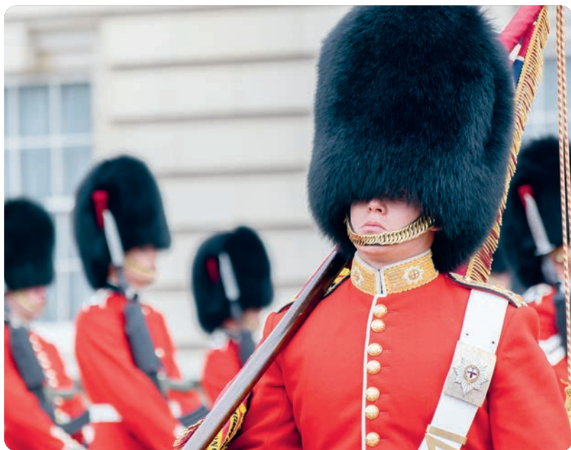
Cambio de guardia, Buckingham Palace (p. 74).