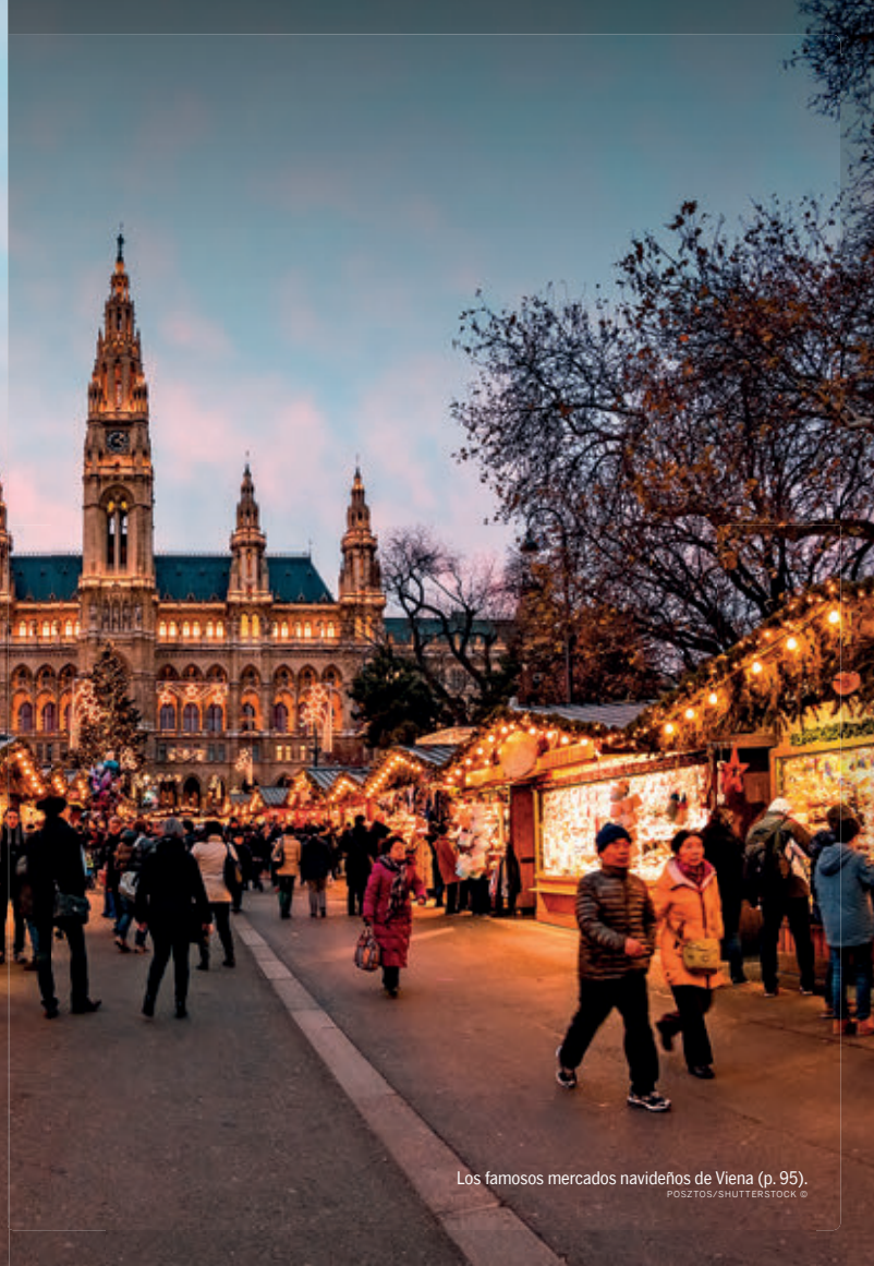
Los famosos mercados navideños de Viena (p. 95).