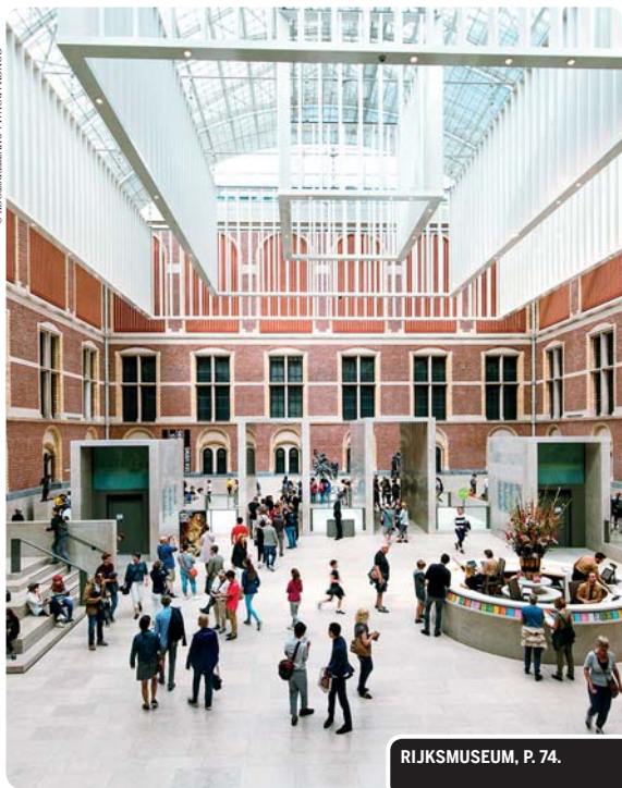
RIJKSMUSEUM, P. 74.