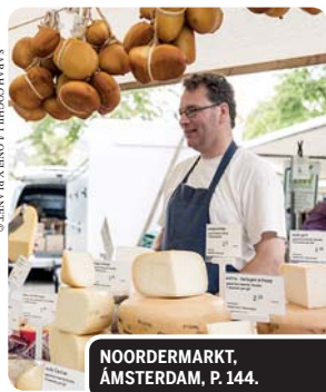
NOORDERMARKT, ÁMSTERDAM, P. 144.