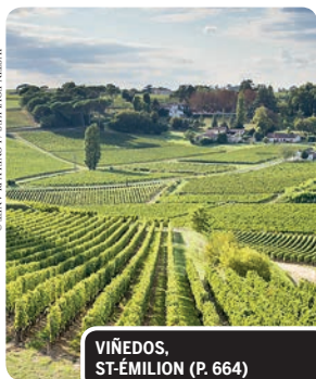
VIÑEDOS, ST-ÉMILION (P. 664)