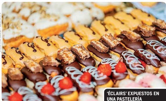
'ÉCLAIRS' EXPUESTOS EN UNA PASTERERÍA