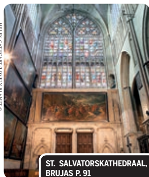
ST. SALVATORSKATHEDRAAL, BRUJAS P. 91