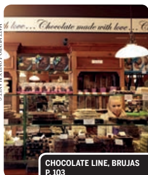
CHOCOLATE LINE, BRUJAS P. 103