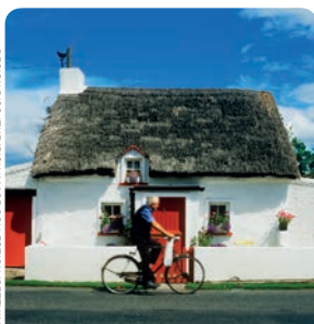
CONDADO DE KILKENNY P. 184